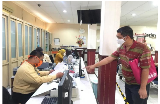
Pelayanan Loker Retribusi Izin Pemakaian Tanah

Jumlah Permohonan Perizinan Yang Masuk Sebanyak 59 Berkas