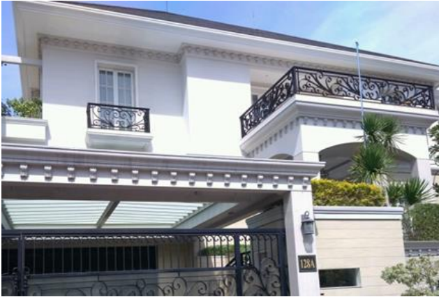
PT Aneka Inti Prospek Graha Famili D No.128 - A