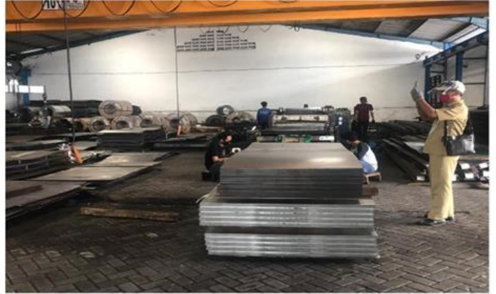
PERORANGAN PERSADA WIJAYA SENTOSA JI Margomulyo Permai III Blok DD - No 8 Surabaya