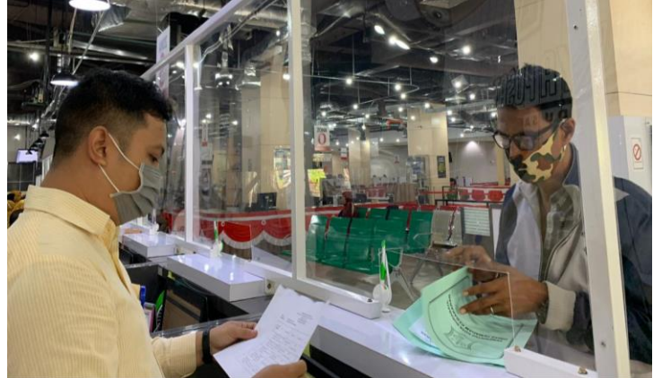
Pelayanan Loker Pengambilan