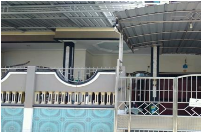
PT Sentra Untung Sejahtera Jl. Pradah Permai III/07