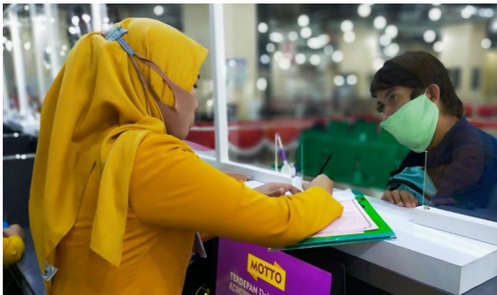
Pelayanan Loker Customer Services