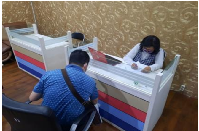
CV Gloria Persada

Jumlah Perusahaan yang Diberikan Asistensi Online Sebanyak 2 Perusahaan