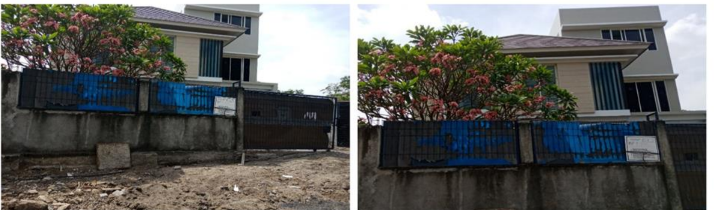
Komp. Perum. Citraland Surya Bukit Palma Blok F-9 Kav. 26 Kel. Babat Jerawat Kec. Pakal