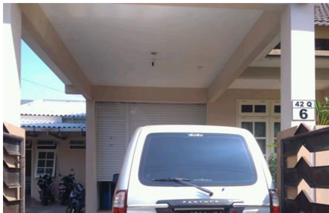
Roti Sherlys Jl. Candi Lontar Blok 42 Q / 06