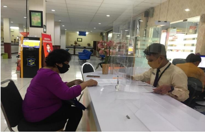
Pelayanan Loker Informasi