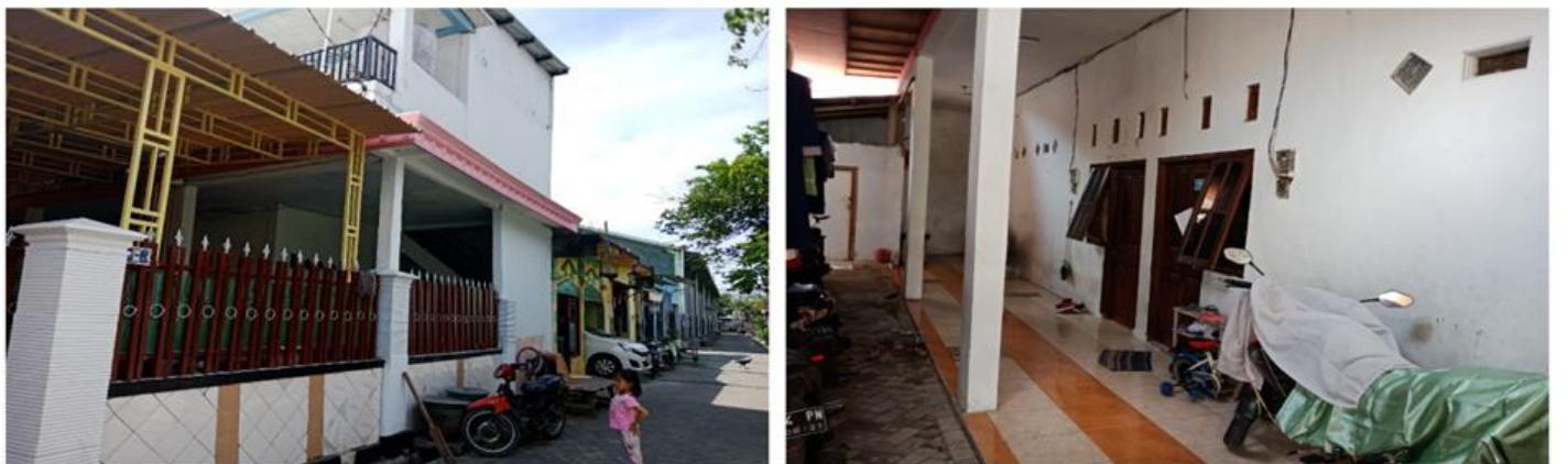
Jl. klakah rejo V no 4 (lama : klakah rejo V no 6-8)