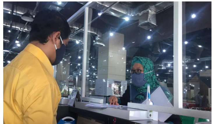
Pelayanan Loker Mandiri

Jumlah Permohonan Perizinan Yang Masuk Sebanyak 106 Berkas