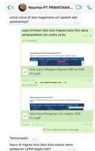
PT Primatama Indoteknik