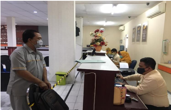
Pelayanan Konsultasi Dinas Kesehatan