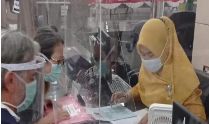
Pelayanan Loker Informasi