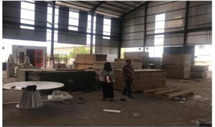
PT CENTRAL ARTE SUKSES Romokalisari Industri III No.24 Surabaya