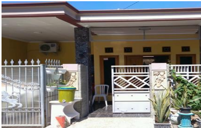
CV Bhanu Arunika Gantari Pondok Maritim Indah Blk. AK/21