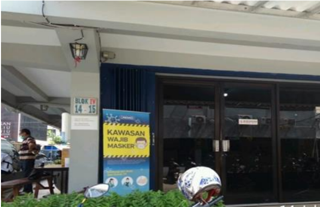
PT Intisumber Hasilsempurna Komplek Darmo Park II Blok IV No.14-15