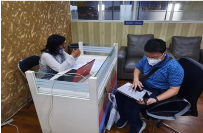
CV Golden Perkasa