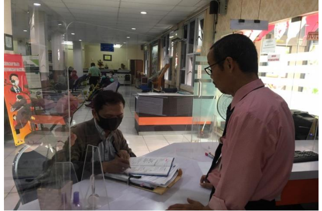
Pelayanan Loker Pencabutan Berkas