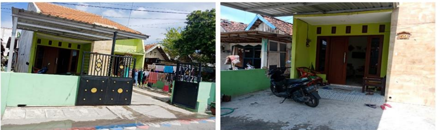
Jl. Tengger Raya II No 59 (Lama : Jl. Tengger Raya )