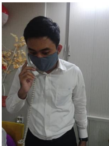
PT Mitra Sejahtera

Jumlah Perusahaan yang Diberikan Asistensi Online Sebanyak 3 Perusahaan