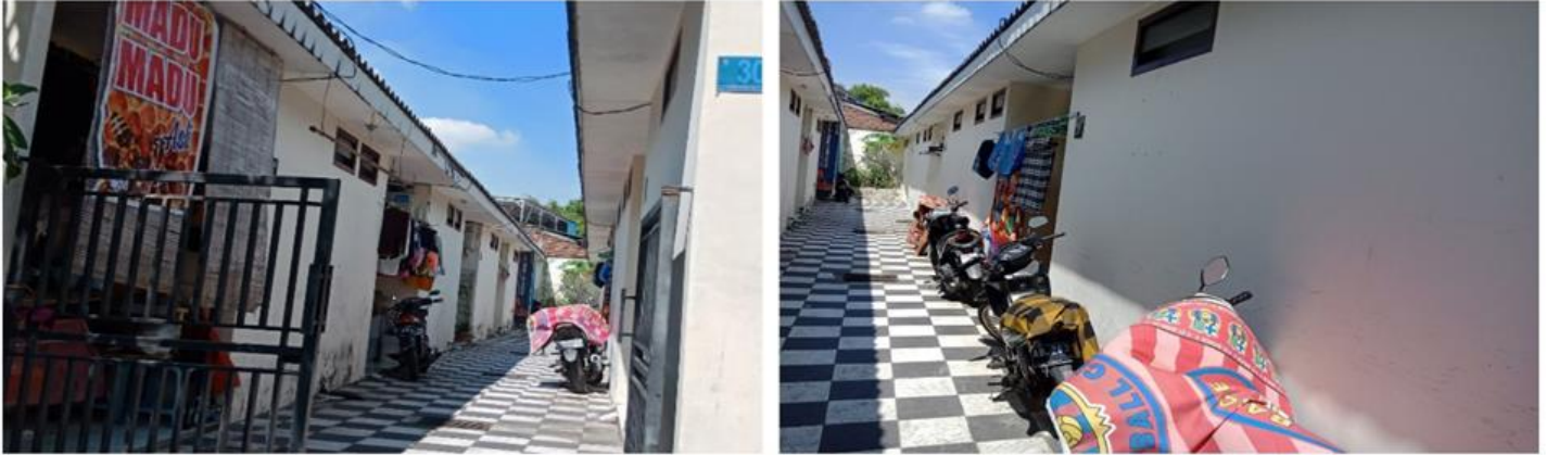
Jl. Jugrug Rejosari I No 30 (Lama : Jl Jugrug Rejosari Gg 1)