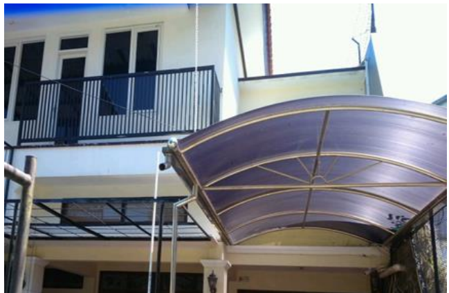
PT Improvisasi Media Teknologi Jl. Dukuh Kupang 28/32